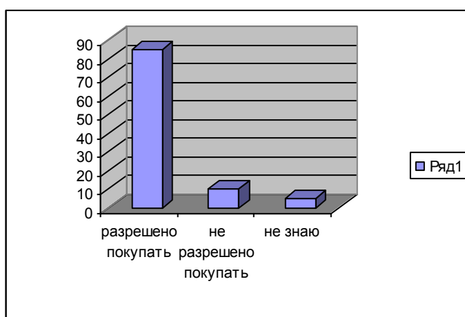
Гистограмма № 1. Разрешено ли несовершеннолетним покупать алкоголь?

Как и в первом социологическом опросе 15% из опрошенных студентов курят и пытаются бросить курить, 25% учащихся также ответили, что употребляют алкоголь только по «Праздникам и за компанию», остальные не употребляют. На вопрос «Разрешено ли несовершеннолетним покупать алкоголь?» 85% опрошенных ответили, что «Не разрешено»; 10% респондентов ответили, что «Покупать разрешено», 5% респондентов ответа не знают.